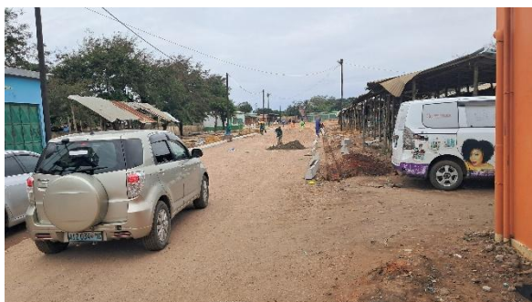
Estrada de acesso á terminal (em reabilitação)