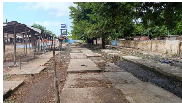
Vista do local e da área de bancas desocupadas.