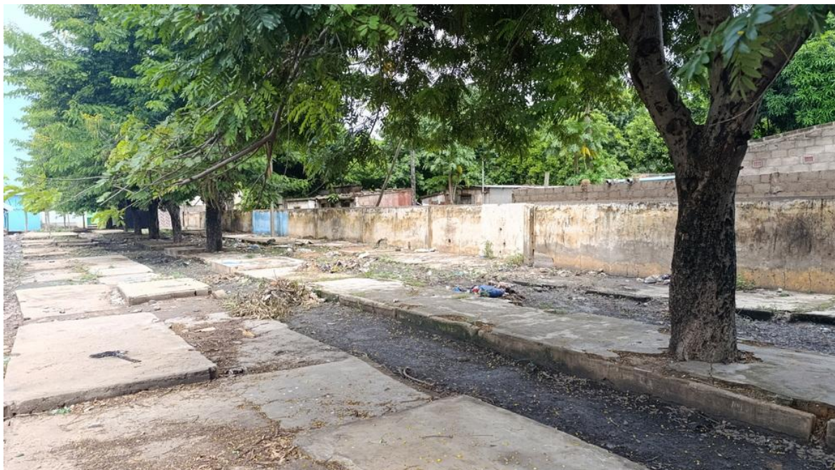
Vista do local identificado no mercado de Xipamanine entre as duas árvores que distam 20m.