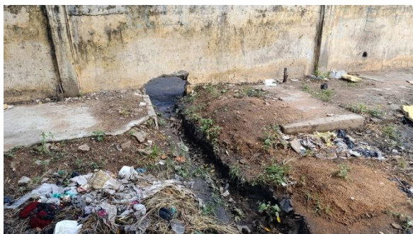
Muro limitante aberto para escoamento de águas