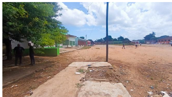
Edifícios nas proximidades do espaço aberto.