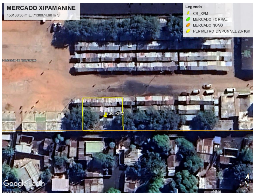
Figura 2 - Identificação do local no mercado novo do Xipamanine

O local identificado apresenta as seguintes características: